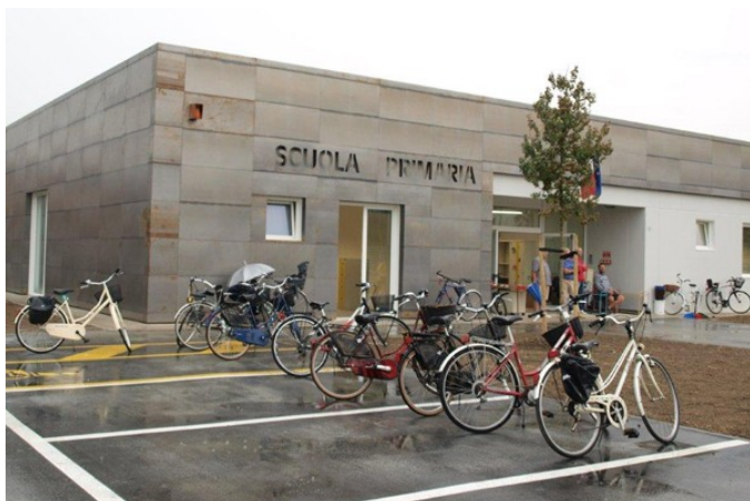
Rolo - nuova sede di via Cornaro

Alla data del 10 novembre sono ultimati tutti gli interventi (l'ultimo rallentato per subentrati problemi con a Sovrintendenza archeologica è previsto il 22 novembre ) ed in totale saranno così reinseriti in strutture nuove (EST e PMS), sicure e di qualità circa 18mila ragazzi e ragazze 8 . Grazie ai lavori di ripristino dei danni più lievi, si può stimare in circa 40-50mila il numero dei ragazzi che hanno potuto iniziare l'anno scolastico regolarmente.